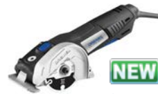
NEW Scie compacte Dremel DSM20

Cette table de pique-nique modernisée fournit un endroit parfait pour partager de la nourriture, des rafraîchissements et des histoires lors de longues et chaudes journées d'été.