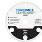
NEW Disque à tronçonner multi-usage en carbure DSM500 (fourni avec la machine)