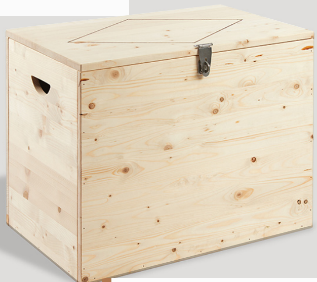
Houten kist met gedecoreerde klep