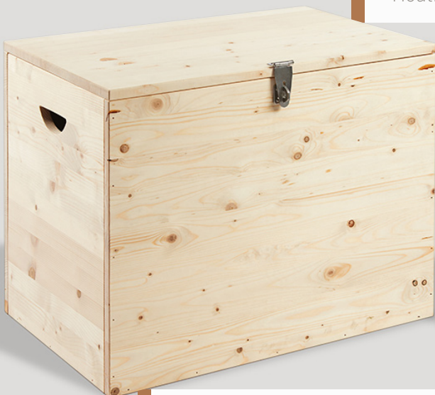
Houten kist zonder decoraties